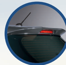
Spoiler Superior Trasero