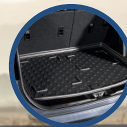
Cubierta en área de equipaje