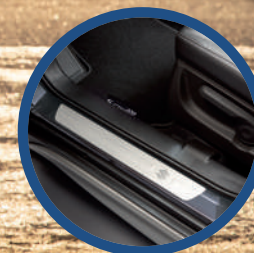
Protección para estribos.